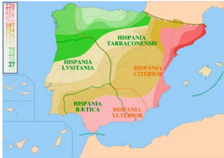
Boven: kaart van Hispania tijdens de Romeinse bezetting

door leeuwen of andere wilde dieren werden verscheurd. Eén van de toeristen wijst naar de overblijfselen van een kruisvormige kerk midden in het amfitheater. Het moet een vreemd gezicht zijn geweest, een kerk in een arena. 'In de middeleeuwen is deze kerk gebouwd om de christenen en gladiatoren te gedenken die er een gruwelijke dood stierven', zo verklaart de gids het bouwwerk. Het is niet moeilijk te fantaseren hoe hier duizenden toeschouwers schreeuwden en joelden bij het zien van al dat bloed. 'Geef ze brood en spelen', was het Romeinse motto om het volk zoet te houden en zo opstanden en revoluties te voorkomen. De entreekaartjes voor een voorstelling in het theater werden 'vomitorio's' genoemd, een term die nu nog steeds in Spanje gebruikt wordt bij de verkoop van voetbalkaartjes. Het duizenden jaren oude amfitheater is tevens een inspiratiebron geweest voor wat we nu kennen als de stierenarena's en de bijbehorende stierengevechten, die vandaag de dag in soortgelijke arena's plaatsvinden. Niet de gladiatoren, maar de jonge Spaanse 'toreros' laten hier trots hun zogenaamde heldendaden zien. In de provincie Catalonië zijn echter veel stierenarena's gesloten, omdat er veel kritiek op is. Wanneer de groep verder het centrum in loopt, stuiten ze op een andere plek waar het volk vermaakt werd: het circus. Deze