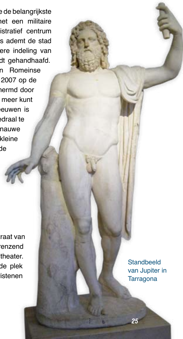
Standbeeld van Jupiter in Tarragona

Aan het einde van de Rambla Nova, de hoofdstraat van Tarragona, vind je de Middellandse Zee en grenzend aan het strand een indrukwekkend groot amfiteater. Het ligt er nu vredig bij, maar was vroeger de plek waar gladiatoren moesten vechten en christenen