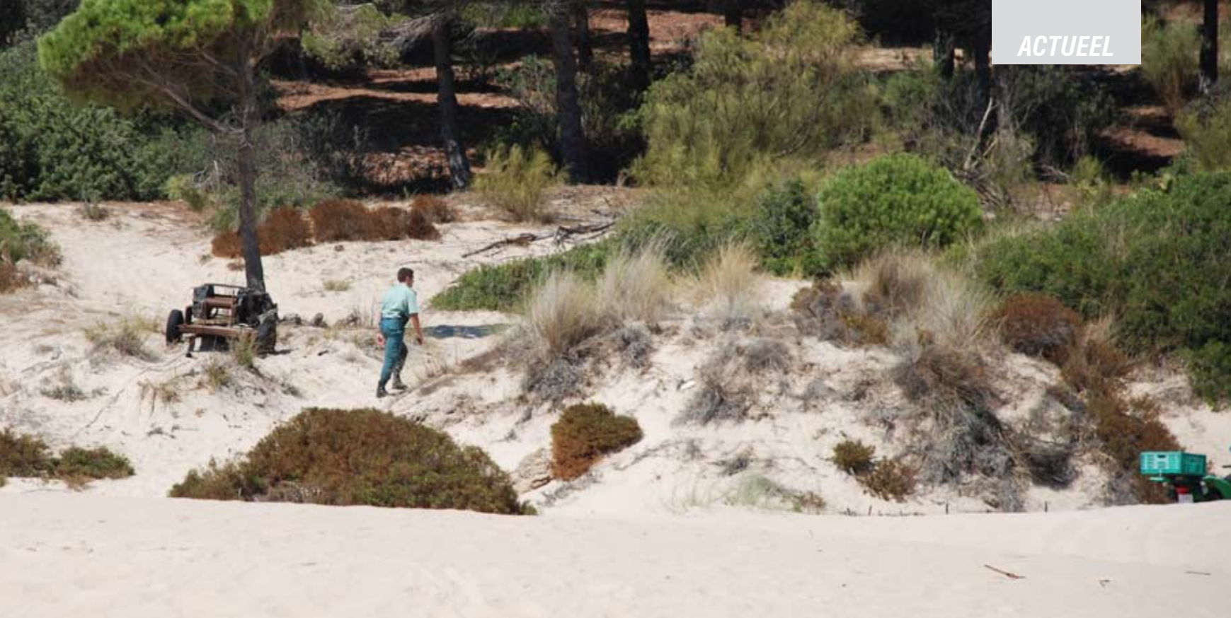
Boven: een Guardia Civil agent inspecteert de duinen

Laura, medewerker bij Accem in Barcelona, is erg kritisch over de manier waarop de overheid omgaat met immigranten. 'Ze investeren constant geld in de kustbewaking, maar daar ligt het probleem niet. Ze kunnen beter voorlichting geven in Afrikaanse landen, waar men denkt dat Europa een paradijs is waar zorgen niet bestaan. Ze weten niet dat ze na aankomst meteen weer worden teruggestuurd. Of dat ze, wanneer ze worden vrijgelaten, door de Spaanse overheid compleet aan hun lot worden overgelaten.' Volgens haar moet ieder mens een waardig leven kunnen leiden, of je nou in een arm of in een rijk land bent geboren. 'Europa vormt steeds meer een fort waar alleen maar plaats is voor intelligente mensen met veel geld. Als goederen en voedsel dagelijks Europa binnenkomen, waarom hebben mensen dit recht dan niet?'