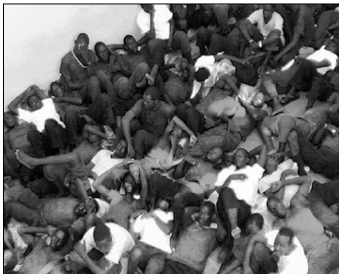
Boven: Erbarmelijke toestanden in de op overvolle opvangcentra in Spanje