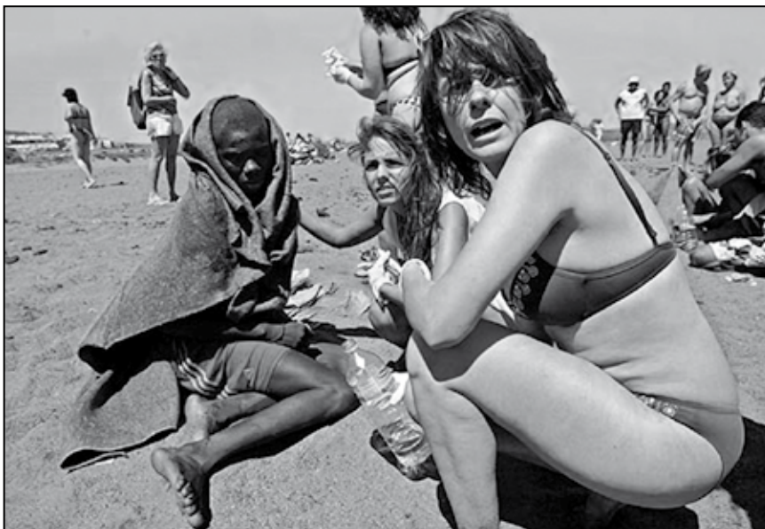
Boven: Een immigranten-jongetje krijgt eerste hulp van toeristen