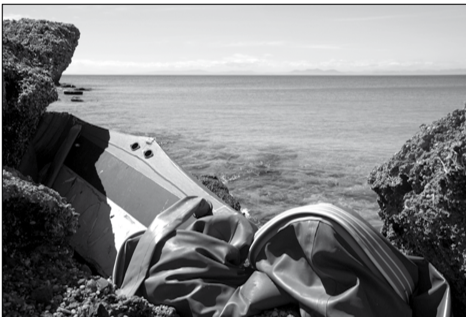
Langs de gehele Atlantische Zuidkust van Spanje kan men overblijfselen van (geslaagde) overtochten van immigranten vinden, zoals hier links een aangespoelde rubberboot

‘Er zat niets anders op dan in een kartonnen doos de nacht door te brengen op Plaza Catalunya en overdag te bedelen om eten’